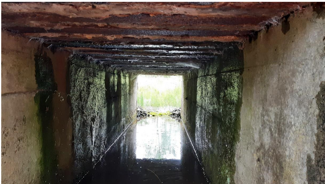
Foto č.5 - Propustek v km 113,306 - Pohled do propustku