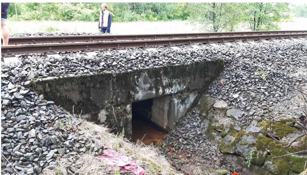
Foto č.4 - Propustek v km 113,306 - Pohled na výtok