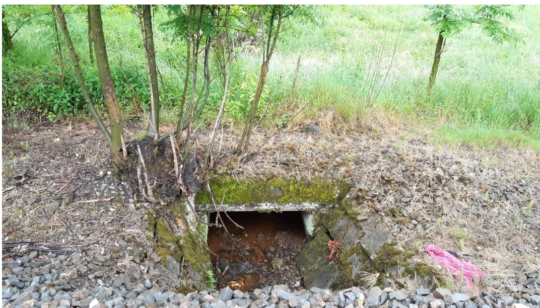
Foto č.6 - Propustek v km 113,306 - Pohled na propustek na výtoku