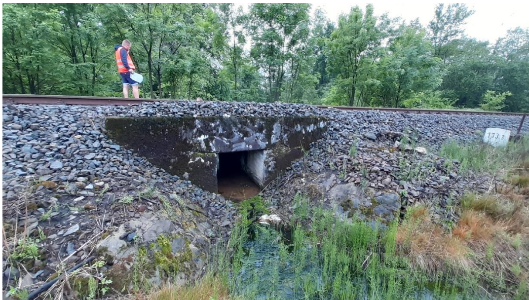
Foto č.3 - Propustek v km 113,306 - Pohled na vtok